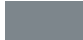
843 Gris plata Cinzento prata