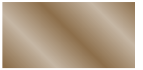
860 Oro rojizo Ouro avermelhado