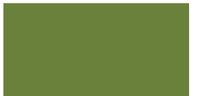
807 Verde oliva Verde azeitona