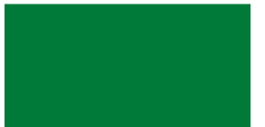
857 Verde hierba Verde erva