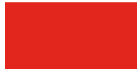
842 Rojo fuego Vermelho fogo