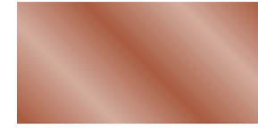
863 Cobre Cobre