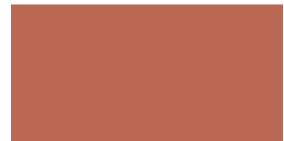
826 Terracota Terracota