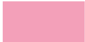
831 Rosa pálido Rosa pálido