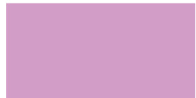
833 Orquídea Orquídea