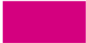
834 Fucsia Fúcsia