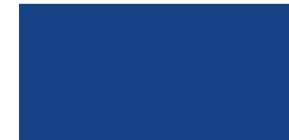
847 Azul ultramar Azul ultramarino