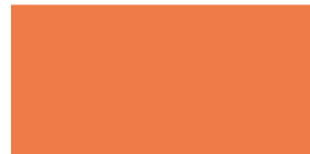
828 Mandarina Tangerina