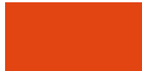
803 Naranja Laranja