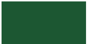
854 Verde jade Verde jade