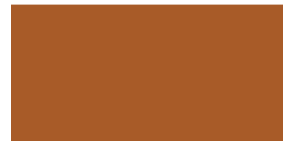
813 Siena tostada Siena queimada