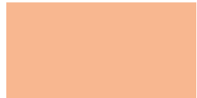
827 Melocotón Pêssego