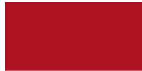
835 Carmín Carmim