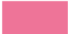
830 Rosa intenso Rosa intenso