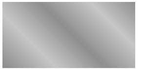
861 Plata Prata