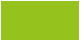
864 Verde pistacho Verde pistácio