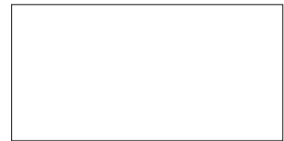
800 Blanco Branco