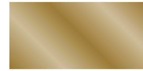
859 Oro amarillo Ouro amarelo