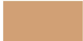
836 Carne Carne