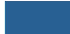
844 Gris naval Cinzento naval